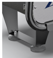
Stabilizing rubber feet version Versione con supporti antivibranti

Version with ø 300 mm 4 pneumatic wheels + brake