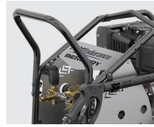
Reversible handle Manubrio reversibile

Kit avvolgitubo con tubo 15/20 mt (su richiesta)